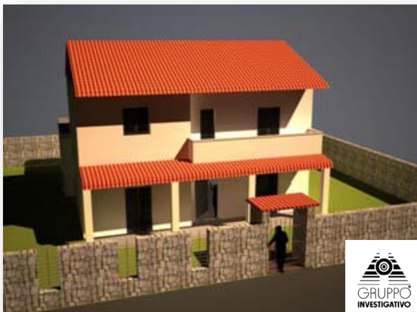
FIGURA 1 - L'IPOTESI RAFFIGURATA PREVEDE L'INGRESSO DELL'OMICIDA, DALL'INGRESSO PRINCIPALE