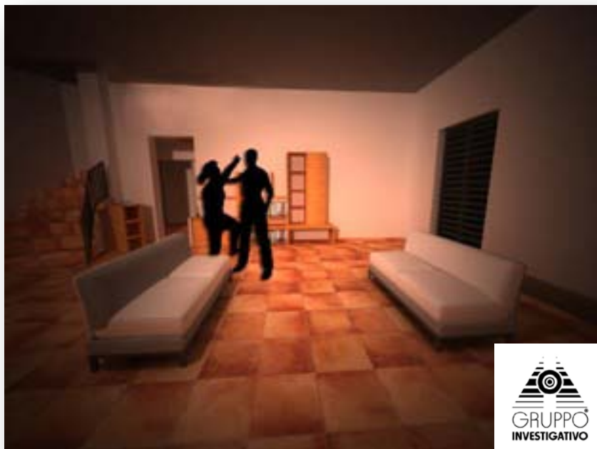
FIGURA 4 E 5 - IN SEGUITO L'AZIONE DELL'OMICIDA POTREBBE ESSERSI SVILUPPATA NEL SALOTTO DELLA VILLA.