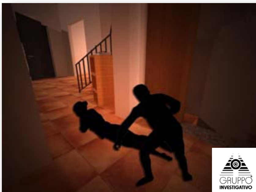
FIGURA 6 - L'OMICIDA TRASCINA IL CORPO DELLA POVERA CHIARA POGGI, NELLA RAMPA DELLA SCALE CHE CONDUCE ALLA CANTINA DELLA VILLA POGGI.