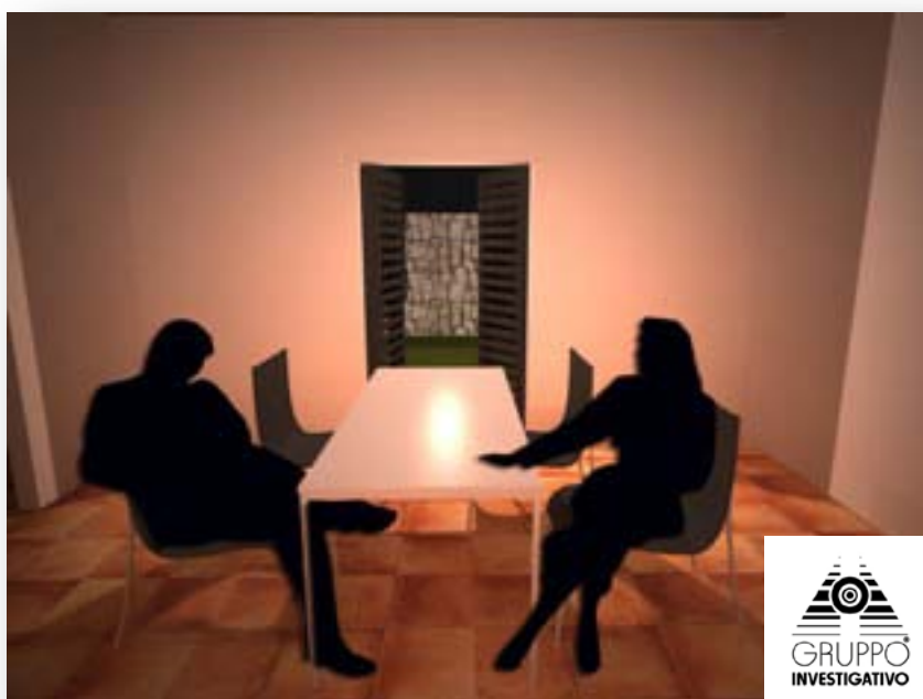
FIGURA 2 - IN SEGUITO L'OMICIDA E LA VITTIMA POTREBBERO AVERE AVUTO UNA PRIMA DISCUSSIONE IN CUCINA.